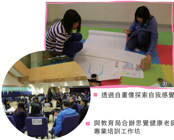
■ 透過自畫像探索自我感覺

2012年是新高中學制與舊學制的交接期，很多學生、家長及社工對此新轉變也顯得無所適從，為了協助青年人面對這困擾，香港明愛社工盡力地為學生提供適當的指導。