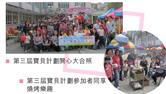
■ 第三屆寶貝計劃開心大合照 ■ 第三屆寶貝計劃參加者同享燒烤樂趣

本年度重點活動之一「第三屆寶貝計劃」，於2013年3月23日舉行。這是一項透過員工及親友捐款推行的社區服務活動，接待一些低收入家庭到中心內參加活動及燒烤。