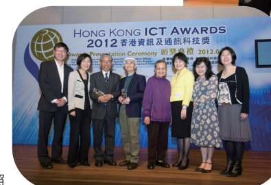
■ 所有獲提名人士大合照