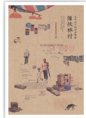
■ 這書輯錄了21個故事，以文化保育角度記載薄扶林村的歷史

明愛薄扶林社區發展計劃員工結合薄扶林村居民之參與，出版了一本新書，將薄扶林村的歷史記錄下來。