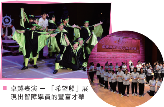
■ 卓越表演 — 「希望船」展現出智障學員的豐富才華

獲伊利沙伯女皇弱智人士基金贊助，明愛啟匡培育中心於2012年10月13日假香港演藝學院舉行結業禮暨大匯演。典禮以「LEAD@different」為主題，殘疾人士經過生活學習及恰當的培訓機會後，展現其獨有之才能。是次典禮超過550位學員成功獲頒不同級別的證書，以表揚其持續學習的毅力，而學員們當日的舞台表演亦獲得觀眾熱烈的讚賞。