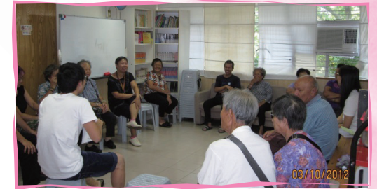
義工組協辦活動：討論與長者相關的議題

明愛西貢社區發展計劃組織居民成立關注組，支援他們處理及關注改善社區環境，同時亦組織功能性組群，例如關注全民退休問題，更透過連結區內個人、組織及團體組成支援網絡，增加社區的關係資產，建立和諧關愛社區，另外亦有向居民介紹不同而有用的社區資源。