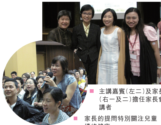
■ 主講嘉賓(左二)及家長(右一及二)擔任家長會講者

獲教育局家庭與學校合作事宜委員會撥款資助，本服務於2012年5月19日舉行了一個名為「以愛傳希望－『健康家庭 快樂孩子』」聯校家長講座，並邀請了家庭基建發展總監為家長主講正向育兒方法，超逾500名家長參加是次講座。