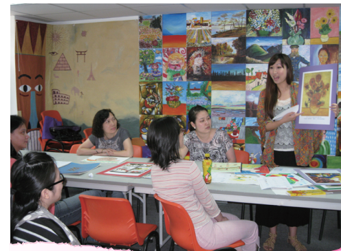
■ 老師參與幼兒視覺藝術培訓課程並分享作品

為提升老師的專業發展，本服務為100多名老師提供一連串與奧福音樂、蒙特梭利教學及美藝教育相關的工作坊及培訓課程。此外，有4位老師於2012年9月參與由教育局語文教育及研究常務委員會舉辦之「優質幼兒英語學習」培訓活動。