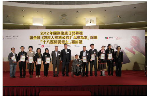
明愛康復服務、明愛家長資源中心、明愛懷寶坊環保回收計劃及明愛天糧包餅工房獲選為「十八區關愛僱主」