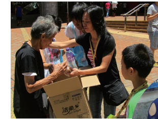
■ 家長也身體力行，把關愛精神感染並延展至下一代

明愛賽馬會德田青少年綜合服務的「麵包送暖計劃」是自2011年開展的社區關懷服務。義工從區內的麵包店回收賣剩的麵包，轉送予區內有需要的人士和家庭，本年度派發麵包的日子由每星期兩天增至五天，不少原來的受助者更加入了義工的行列，成為助人者，經驗到助人的樂趣和肯定自身的價值，大大增加了鄰舍間之關懷氣氛。