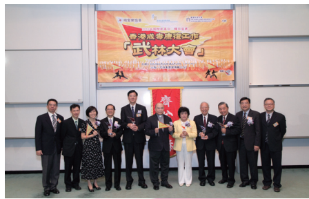
■ 「武林大會」開幕典禮 – 此項目由香港明愛、香港社會服務聯會及香港科技大學合辦

明愛樂協會素以籌辦戒毒工作培訓及交流活動見稱。該會獲得禁毒基金撥款，推行為期兩年之「解毒知補系列」，在2010年11月16日至2012年11月15日期間舉辦了共11項訓練及交流項目。此系列盛事甚多，特別是在2012年6月25日至2012年6月26日在香港科技大學舉行之「香港戒毒康復工作武林大會」。當日共有來自90多個機構 / 單位超過250人出席此交流營。