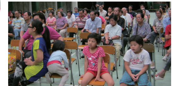
居民和警務署元朗區公共關係科代表會面

明愛洪水橋社區發展計劃組織街坊自發成立「丹桂村、和平新村寮屋居民關注組」，多年來一直與區內居民一起回應洪水橋新發展區規劃及工程研究的事件。今年，關注組舉行了一次居民大會，與警務署元朗區公共關係科代表會面，活動中由總督察向居民說明警方在清拆建築物程序中的角色，為居民和警方提供了直接的溝通渠道。