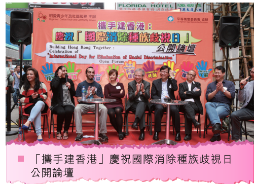
■ 「攜手建香港」慶祝國際消除種族歧視日公開論壇

「攜手建香港」慶祝國際消除種族歧視日公開論壇於2013年3月17日在旺角行人專用區舉行。出席嘉賓及少數族裔青年代表表達了他們的關注事項，例如：語言政策、教育及就業機會。當日不同形式的文化交流推廣攤位吸引了不少途人參與。