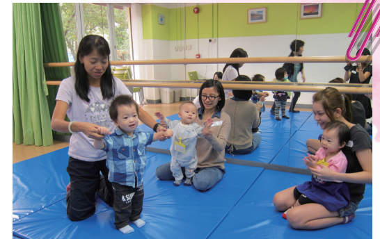
■ 親子音樂律動訓練 – 嘩！BB跳舞呀！

幼兒心智發展是兒童成長的基石。在香港，很多貧窮家庭未能為年幼兒女提供所需的培育和環境，而社區內亦缺乏專為嬰幼兒而設的服務及支援。明愛荃灣綜合家庭服務中心獲得李國賢兒童基金贊助，開展為期一年的「與B同行 – 嬰幼兒早導計劃」，旨在填補服務空隙，令基層家庭的下一代有較為公平的發展機會，以望擺脫跨代貧窮。計劃重點為促進嬰幼兒的身心發展，培養良好親子關係，服務對象為育有零至三歲幼兒的基層家庭。計劃內容包括親子學前活動、親職教育課程（包括「兒童為本」遊戲治療及Triple P正向管教家長工作坊）、由言語治療師、教育心理學家及牙科醫生為基層家庭的嬰幼兒提供專業諮詢、評估及轉介服務，並派發有關嬰幼兒發展的資源套予區內家庭，及於中心內設立資源角，計劃同時亦建立「Super Baby」互助網絡，定期舉辦親子品德教育活動。