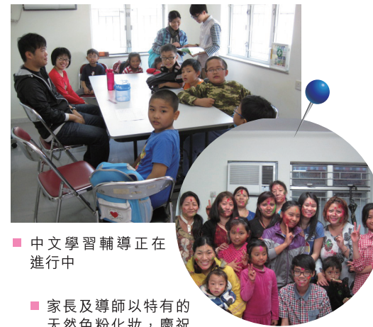
中文學習輔導正在進行中

明愛元朗鄉郊社區發展計劃與南亞裔婦女「天使小組」舉辦「文化共融·互惠學習計劃」，12位本地大專學生獲邀參與，他們為18位來自低收入家庭的南亞裔學童提供免費中文學習輔導，學童家長為這些大專學生提供文化體驗活動作為回饋，其中一項活動是參與慶祝尼泊爾的一個傳統節日慶典「春之節」，內容環繞著繽紛的色彩，甚具特色。