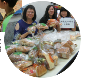
■ 家長互助組織之「愛心麵包大行動」，讓家長發揮互助精神，肯定自己的價值