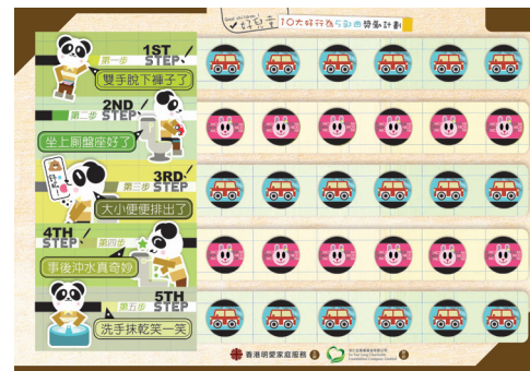
■ 兒童10大好行為5部曲獎勵表：透過清晰易明的步驟讓兒童學會正面有效的的生活與學習技巧

獲得余仁生慈善基金的贊助，20位懷疑有「發展遲緩」的兒童及其家庭接受了明愛家庭服務提供的「個別學習計劃」、「遊戲治療」及「正向管教課程」。數據分析顯示了良好的介入效果：受惠兒童在「零至六歲兒童發展篩檢量表」中的表現顯示他們發展遲緩的情況明顯減輕，而家長在「親職壓力量表 – 簡短版」中的表現亦顯示他們的親職壓力明顯下降。