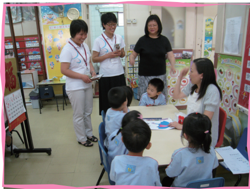
■ 訪客參觀課室小組教學活動

於2012年5月7日至2012年5月9日，五位來自河北省廊坊耶穌聖心傳教女修會的修女探訪香港明愛扶幼服務，在三天交流活動中，他們參觀了三所學校－明愛打鼓嶺、明愛鯉魚門及明愛啟幼兒學校，並進行教室觀課活動。參觀者十分欣賞兒童的主動學習，尤其讚賞學校教學團隊建立的關愛文化，及為弱勢家庭提供的服務。