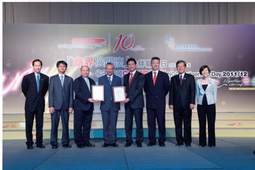
香港明愛與香港迪士尼樂園度假區同獲商界展關懷「傑出伙伴合作計劃獎」，以表揚雙方共同推動殘疾人士就業的努力

明愛樂務綜合職業訓練中心榮獲香港社會服務聯會頒發商界展關懷「傑出伙伴合作計劃獎」，此獎項公開表揚其與香港迪士尼樂園度假區協作的努力，藉「身體有障礙人士學徒計劃」推動殘疾人士就業機會。