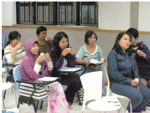
在健康講座上，營養師向婦女傭工講解健康飲食與預防癌病的關係

亞洲外地勞工社會服務計劃積極推動外傭聯會爭取完善港府檢討外傭最低合約工資的機制，針對收集意見渠道及與外傭團體會議的安排等反映意見。另外，這計劃亦定期舉辦每月身體檢查、健康關注日、婦女健康講座、減壓課程，鼓勵壓力大的外傭婦女組成互助小組。