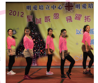
■ 爵士舞組在2012年聖誕感恩自助餐舞會中演出

本年度爵士舞組參加了第33屆沙田區舞蹈比賽，獲得公開組－爵士舞組別的銀獎。此外，亦有四位爵士舞組成員，參加了2012年8月舉行的澳洲聯邦舞蹈教師協會（香港區）考試的爵士舞一級試，取得榮譽獎，此乃同學們首次參加專業舞蹈考試並獲取優異成績，日後會鼓勵更多有興趣的同學參與，挑戰自我。