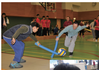
■ 參加者參與體適能訓練活動

獲伊利沙伯女皇弱智人士基金撥款47萬元予本服務，為老齡服務使用者提供特別計劃，以推廣強健體魄、健康照顧和及早介入的訊息。透過邀請不同專業團體及學者，先後為有需要之智障人士提供一連串的服務，包括牙齒檢查、牙科診療、視力和聽力檢查、體適能訓練活動等，超過400位智障人士及100位家長受惠。