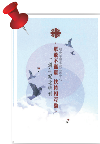
■ 新特刊的標題是「單飛不孤單·扶持相互勉」