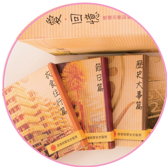
■ 腦退化症長者懷緬訓練教材套

本服務兩位職業治療師合力製作一套名為「愛回憶」的腦退化症長者懷緬訓練教材套，以助前線員工進行懷緬治療。服務分別於2013年2月27日及2013年3月7日，舉辦2次培訓坊，教導員工有效使用這份教材套，共114名員工出席。