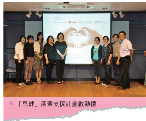
■ 「思健」朋輩支援計劃啟動禮

本服務之精神健康綜合社區中心獲「思健」撥款資助，推行一項為期三年的「朋輩支援計劃」，計劃將聘用一些經培訓後的「過來人」為「朋輩支援工作員」，希望以他們的經歷與智慧，為復元人士提供支援服務。計劃預計合共聘用三位全職或六位兼職朋輩支援工作員，讓康復者能投身這有意義的工作，協助其他有需要的復元人士。