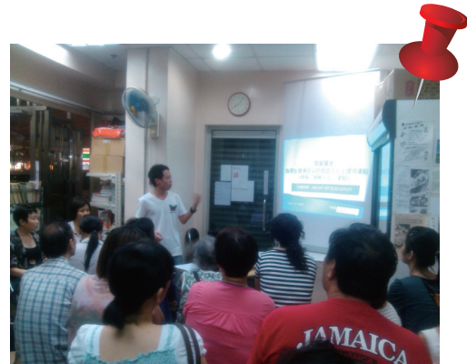
明愛居民互助中心 - 深水埗舉行居民會，組織租住私樓的低收入家庭關注自身住屋需要

明愛居民互助中心 - 深水埗組織租住私樓的低收入家庭，舉行多次居民會，討論住屋需要及居住問題。居民成立關注組爭取租金管制立法、關注房屋政策及租住惡劣環境的支援措施。