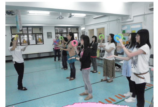
■ 奧福音樂寶盒課程

本服務於2012年7月21日舉行2012年教師與校長退省會，主題為「傳承關愛共融文化，實踐優質幼教服務」。分組討論的焦點是從不同角度，包括兒童全人發展、家庭及家長支援、專業發展團隊等，融合明愛之願景、使命與價值觀，建造關愛共融機構及學校。