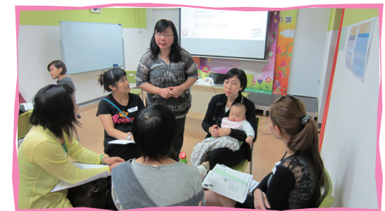
■ 3P模式親職教育課程 – 家長學習正面管教技巧