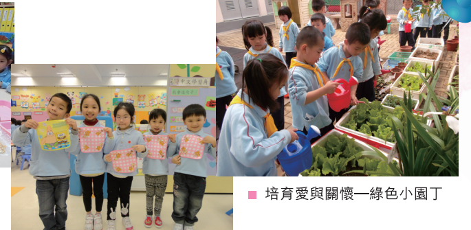
培育愛與關懷—綠色小園丁