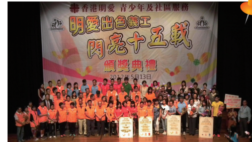
■ 義工在典禮中接受嘉許

2012年5月13日，本服務匯聚652位不同年齡的義工，假香港浸會大學會堂舉行出色義工嘉許暨頒獎典禮，有71位連續參與15年義務工作的義工獲頒發金青章，37位獲傑出義工獎及10個服務計劃獲選為出色義工服務計劃，同場接受嘉許。