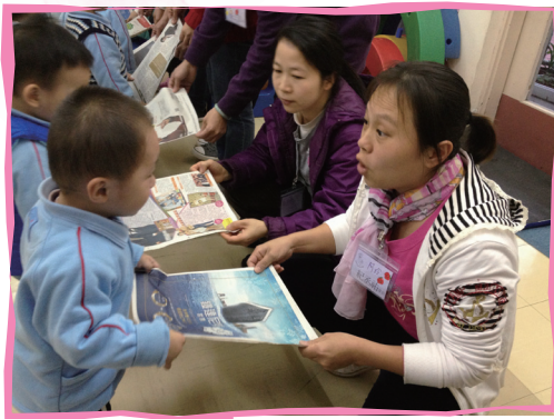
■ 透過互動遊戲促進親子關係

明愛啟幼兒學校參加了由香港大學及香港理工大學合辦之「『啟步』－兒童成長計劃學前親子課程」，為12位貧困家庭的兒童及其家長提供一系列之親子培訓課程，藉以透過高質素之學習活動及家長教育，充權家長成為育兒的夥伴，促進兒童學習與發展。