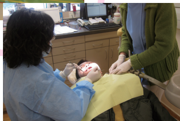
■ 服務使用者接受牙齒檢查及牙科診療