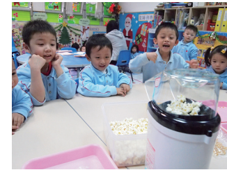
「變出甚麼來？」好奇心誘發兒童的自發性學習

扶幼服務（“本服務”）本著有教無類與培育幼兒全面發展的宗旨，為單親及雙職工之家庭提供二至六歲稚齡兒童及輕度弱能兒童教育與照顧服務。