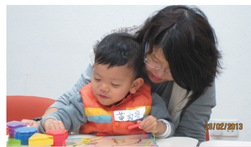
■ 言語治療師諮詢服務 – 媽媽：「這服務為兒子提供了專業的評估。」