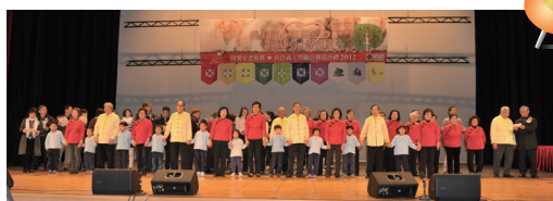
■ 義工同唱大會主題曲

為紀念「出色義工嘉許計劃」10周年，本服務在2013年1月5日舉行的義工嘉許禮，特別以「義工同心顯關愛 十載同行傳希望」為大會主題。當日共有1,359名義工和23個義工團體獲頒發獎項。大會除按義工服務年資頒發不同顏色的獎牌與10位義工外，亦向3名傑出長者義工，頒發義工角色提升獎、義工持續熱誠獎及體弱長者也可貢獻獎。