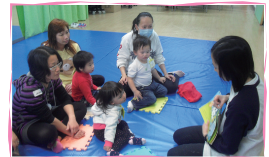
■ 親子故事樂 – 故事引起BB的興趣