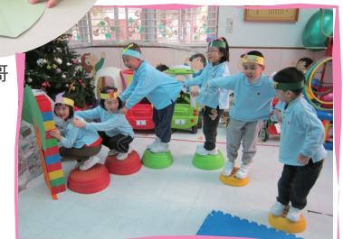
聖誕慶祝—兒童透過戲劇表達「愛與希望」