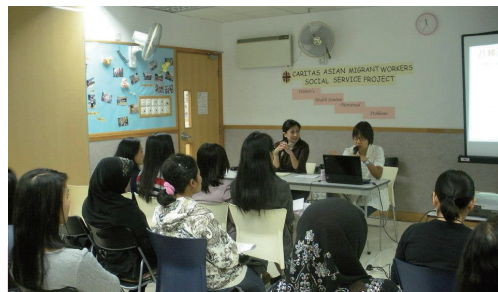
外籍婦女傭工留心聆聽中醫師講解有效幫助舒緩月經不適的健康湯水及按摩方法